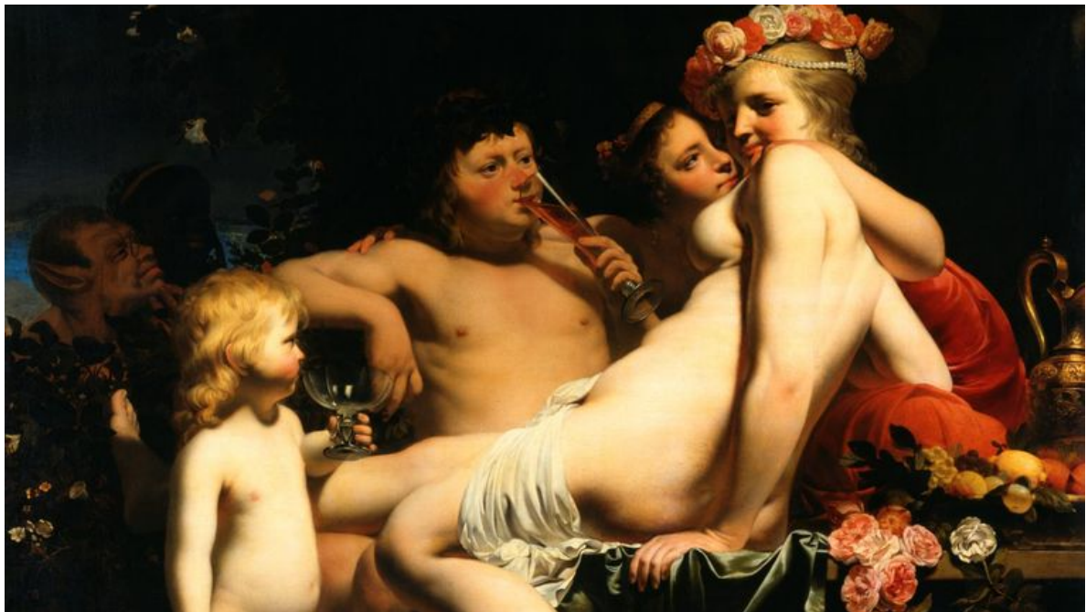
'Bacchus en Venus', vervaardigd tussen 1650 en 1660.

Er zijn veel eigenaardigheden waaraan men de 17de-eeuwse Alkmaarse schilder Caesar van Everdingen kan herkennen (dat hij de helft van zijn modellen zonder wimpers schilderde, om iets te neemen), maar het meest in het oog springend zijn toch zijn borsten